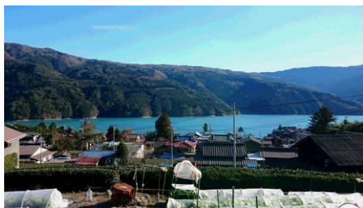
ユネスコエコパークの登録地・井川