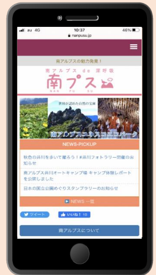
スマートフォン版