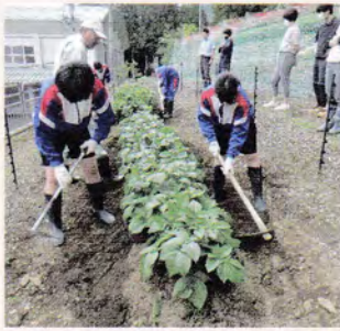
丹精こめて作ります

井川小中学校は、9年間の学びの軸に環境教育を位置付け推進しています。令和3年度は、南アルプスユネスコエコパークにある小中学校として、南アルプスの大自然や自然と人のかかわりについて学習していきます。まず、スタートとして、「南アルプスユネスコエコパーク井川自然の家」から、多くの鳥や植物、昆虫を