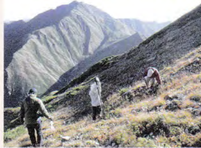
秋の防鹿柵撤去の様子

小屋の周辺をはじめ今まで被害の少なかった場所でも食害が見られました。今後も引き続き、防鹿柵の維持などの対策が求められています。 高山の短い夏に、いっせいに咲き誇る高山植物のお花畑は、たいへん見事なものです。皆さんもぜひ一度ご覧ください！ また、機会があれば、高山植物の保護活動にぜひご参加ください。