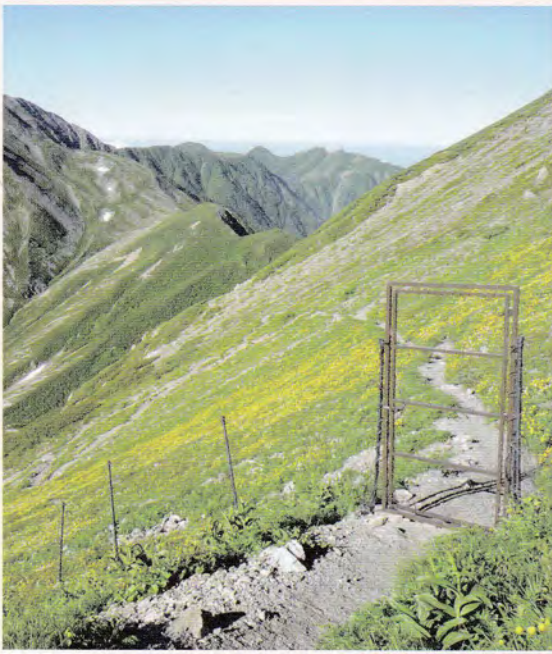
登山者は、荒川岳のお花畑に設置された防鹿柵の扉を開けて通る

一方で、防鹿柵の外側ではシカによる食害が進み柵の内外での差が明確になってきています。また、新型コロナウイルスの感染拡大を防止するため山小屋の営業が休止された昨年は、山