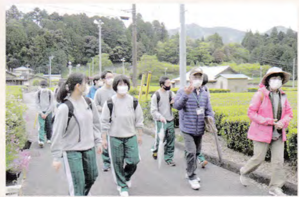
町内をめぐるフィールドワークの様子