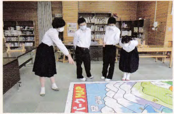
南アルプスの自然や人との関わりについてみんなで学びます

よる交流や、井川地域でのドングリからの苗木育成試験など、新たな取組が始められています。