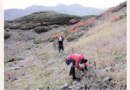
丁寧に作業していきます