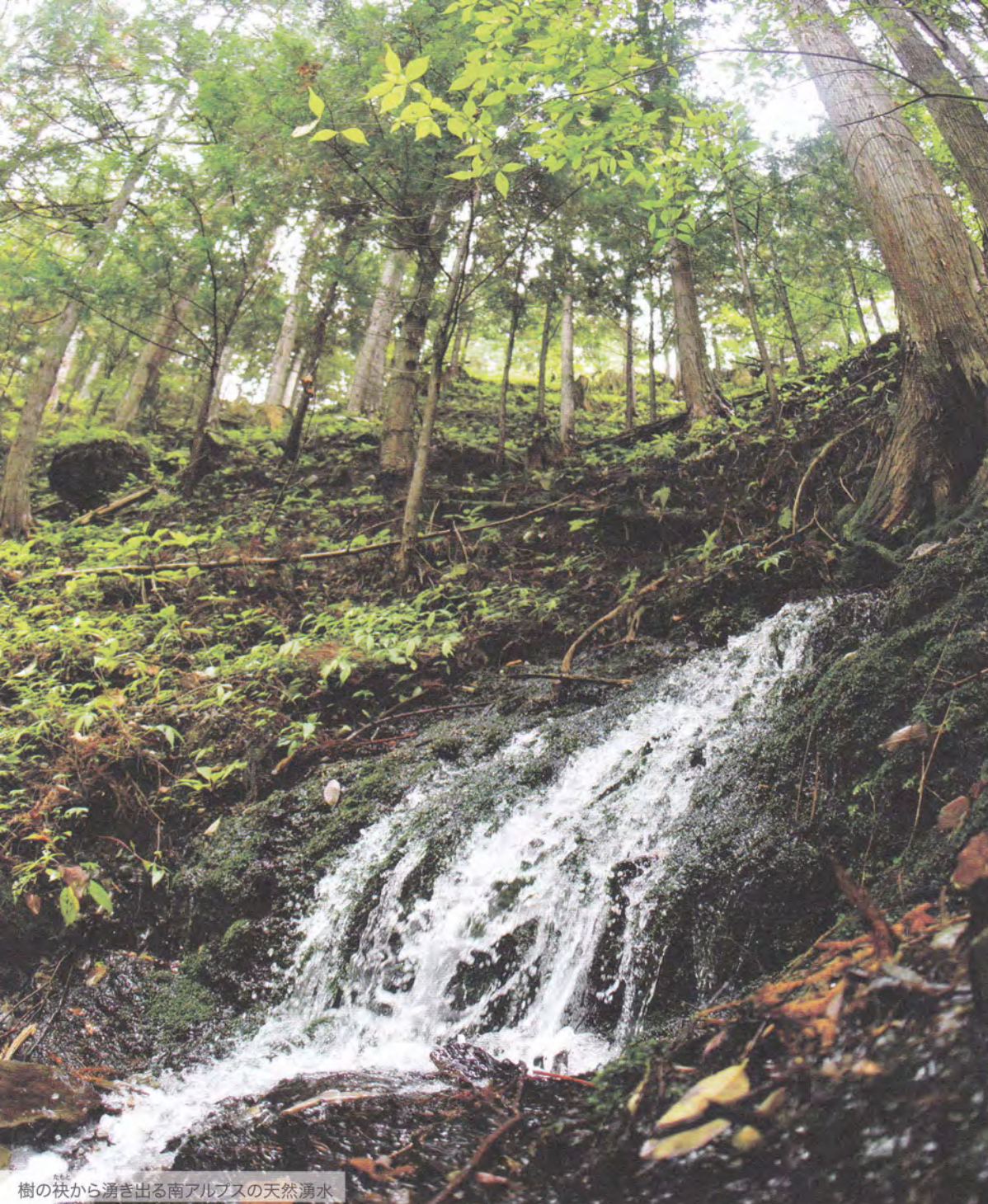
樹の袂から湧き出る南アルプスの天然湧水