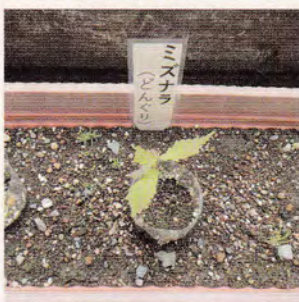
ミズナラの試験育成(井川支所)

3年後の令和6年には、南アルプスユネスコエコパークは登録10周年を迎えます。これからも私たちに多くの恵みをもたらす豊かな自然を登録地域の方々と一緒に守るため、井川小中学校と川根本町の中学校とのエコパークの学習に