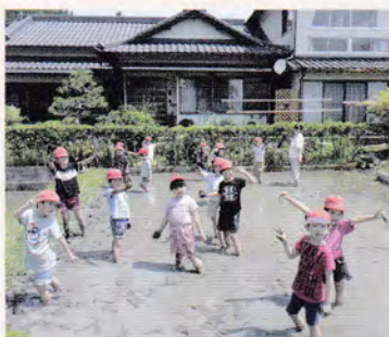
楽しみながら学びます

エコティかわねでは、町内の小中学校や高校に向けた出前講座を行っています。内容は町内をめぐるフィールドワークやトレッキング、田植え、稲刈り体験など様々です。講座内容は学校の先生方と話し合っ