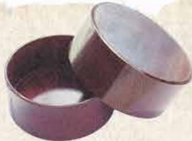
井川の伝統工芸品 井川メンバ

メンバは山仕事の人たちが弁当箱として使っていた入れ物です。ヒノキの板材を曲げて形を生成し、サクラの皮で繻い上げ、天然漆を塗って仕上げられています。美しい光沢があり、丈夫で長持ちするのが特徴です。