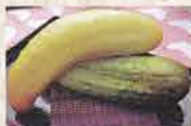
井川の在来作物 (左:井川おらんど、右:地温いもゆり)

「在来作物」とは、ある地域で伝統的に育てられてきた昔ながらの野菜や作物のこと。井川には多くの在来作物が残っています。品種改良された現代の作物にはない風味と深い味わいが特徴です。